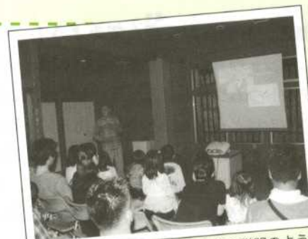
昨年の観察前の説明のようす

期間中「丸山公園」のホタル情報は http://www5.ocn.ne.jp/~aki2000/hotaru1.htm で、ほぼ毎日更新しています