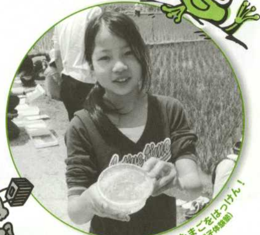
さっそく、カエルのたまごをはっけん! (2011年6月19日 カメリア親子体験)

みんなは、ホタルや田んぼにすむいきものを 観察したことがあるかな? よく見てみると、 おもしろい動きをしていたり、不思議なかたちを していたり、発見がいっぱいだよ! 「あ・そ・ぼ」 をよんで、君も身近ないきものを観察してみよう!