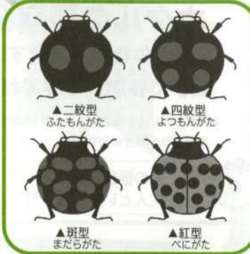
テントウムシの種類