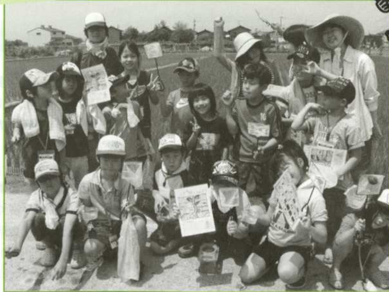
いきもの観察はじめるぞ! おー! (2011年6月19日 カメリア親子体験)